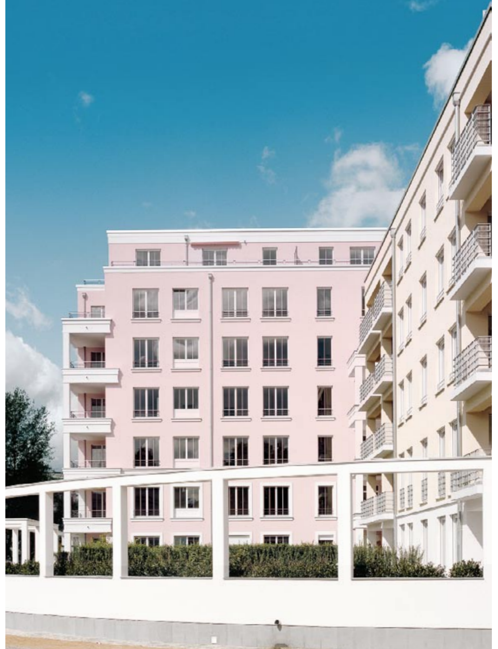
Hofjäger Palais Berlin

In this, Investa Immobiliengruppe operates both on the basis of a more traditional development model as well as on behalf of institutional property investors. Investa Immobiliengruppe also develops and sells superlative quality owner-occupied apartments in good to outstanding residential districts in Munich and Berlin as Sedlmayr-Investa Immobilien GmbH, a joint venture operation with Sedlmayr Grund und Immobilien KGaA and Investa Projektentwicklungs- und Verwaltungs GmbH.